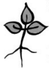
Plattdütsk in de Kerken